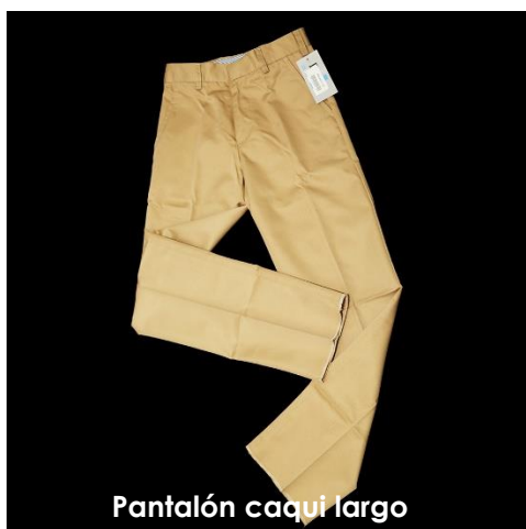
Pantalón caqui largo