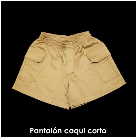
Pantalón caqui corto