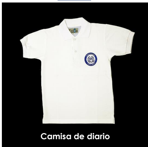
Camisa de diario