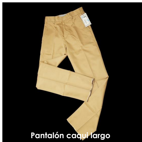
Pantalón caqui largo